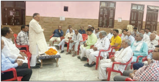
बैठक को सम्बोधित करते हुए व्यक्त किए। उन्होंने कहा कि कांग्रेस के पास देश को आगे बढ़ाने का कोई एजेंडा नहीं होता बल्कि जात-पात, धर्म, क्षेत्रवाद की राजनीति का सहारा लेकर वोट की राजनीति करती