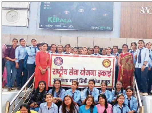
फिल्म में दिखाया गया है वह लड़कियों के साथ गलत करते हैं लड़कियां भावुक होती हैं

टीम एक्शन इंडिया/मथुरा/लोकेश चौधरी। राष्ट्रीय सेवा योजना इकाई की 112 छात्राओं ने सिनेमा हॉल में आयोजित विशेष शो में 'द केरला स्टोरी' फिल्म देखी, फिल्म देख कर छात्राएं भावुक हो गईं। 'द केरला स्टोरी' फिल्म देखकर छात्राएं सिनेमा हॉल से निकलने के बाद भावुक दिखाई दीं और छात्राओं की आंखों में आंसू थे, वहीं छात्राओं का कहना है कि यह फिल्म सच्ची घटना पर आधारित है, जो कुछ भी