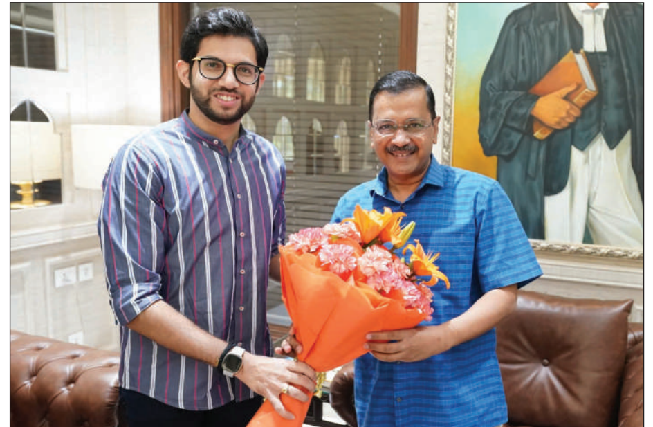
महाराष्ट्र के पूर्व मुख्यमंत्री उद्धव ठाकरे के बेटे आदित्य ठाकरे ने रविवार को दिल्ली के मुख्यमंत्री अरविंद केजरीवाल से उनके आवास पर आकर मुलाकात की है।